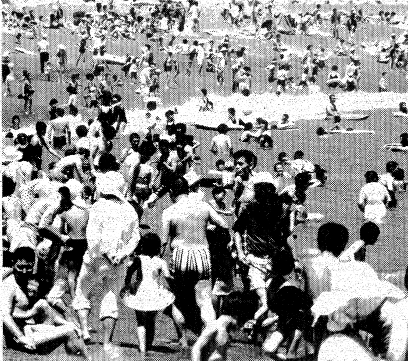
砂は熱く、水は冷たい水遊び 一 波立海水浴場

海のあるすいわき市は連日、市内外の浴客でにぎわっているが、台風が去った十日の日曜日、高波と低水温、久之浜が遊泳禁止になったほか、海水浴場は寒く、脱衣場から出る人も入り込み総数は四十五万二千五百人(市観光課調べ)に達した。また、三十日現在では百万人を突破、昨年の倍以上を記録した。