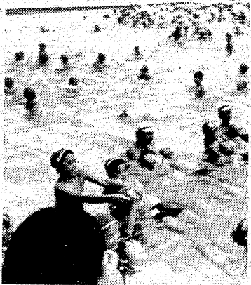
炎暑の中 体調を崩さないよう

蚊の駆除、手防接種、これが対策はな い。この病氣は、日本脳炎(日本脳炎)である。し かも、死に傷や後遺症を考へると、これは 恐ろしい病氣である。たとえ発症が 少ない、たとえ軽微な症状を許すに かならない。