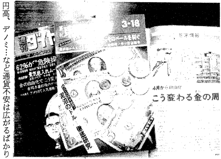
田高、デノミ...など通貨不安は広がるばかり

このところ、金(金の棒)の売れ行きが目立っている。フランスでは左翼政権誕生を恐れた資産家が金買いに狂奔しているというが、日本では円高とデノミ論議が原因となっている。