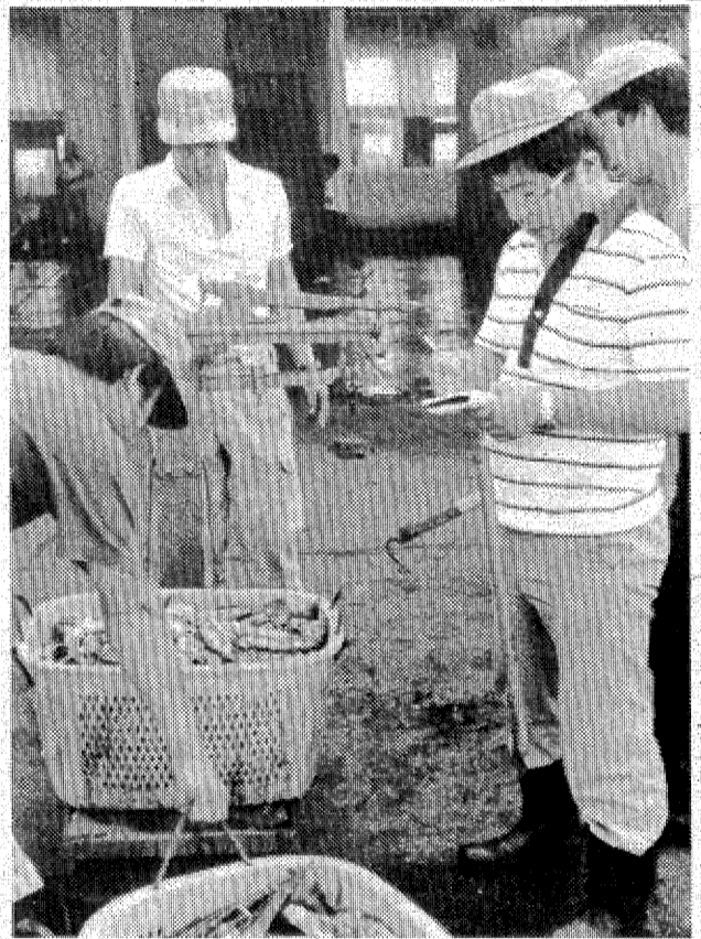
▲たとえ1分の誤差でも水揚げ漁船にとっては貴重 慎重に秤量する市場の仲買人

いま小名浜魚市場に、ムラサキイカが大量に水揚げされている。同港を基地にイカ釣船が出漁しているため、ほとんど宮城県からの回船、地元からも出漁しているが、サキイカ産地が増えているのには驚く。小名浜の南東沖と、塩屋崎沖には、広範囲に魚群が発見されているという。七月三十一日などはイカ好漁、船べりに釣り糸を投げ、大きな電球を船の上につらき、キロ二百七十円から三百七十五円（一日で取引されている。イカ釣船四つ並ぶ、なじみの薄い船型だ。だが、イカの価値に刺戟されて、サキイカを水揚げしているもの。朝露が降ると、船も入って五十六隻のイカ釣船が入り、三十三・五のムラサキイカを揚げたが、目を増すというからなかなかの好漁である。ムラサキイカも近年になって漁場が開発された。イカ、値段も