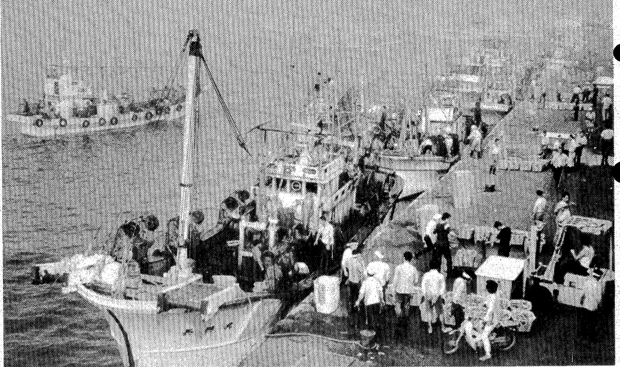
▲朝露にかすむ午前6時半 小名浜魚市場に続々とムラサキイカを水揚げする漁船群