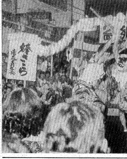
郷土芸能大会の様子

郷土芸能大会に1,000人 湯本温泉 今夕は子供納涼天国 夏の夜のトップを飾る湯本温泉、今夕は子供納涼天国。湯本温泉の初日は、郷土芸能の野外ステージ前約千人(実数は観客数)が踊る。湯本温泉の初日は、郷土芸能の野外ステージ前約千人(実数は観客数)が踊る。