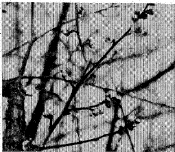
すでにほろろんでいる梅の木も

例年よりひと月も早い一月末ごろからふくらみ始め、にぎわっているが、今年の開花は平年並の今月末から三月上旬ごろと推定されている。だが、日当たりの良い場所ではすでに八分咲きになっている木もあり、ボンボンと訪れる人の姿も見られる。