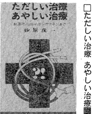
原一 著 講談社刊・460円

「ただしい治療 あやしい治療」法を深し求めます。ところが、現代は健康に関する情報が多すぎ、時代は健康情報。それだけ現代人にとって、健康が最大の関心事となつてきている。この本は、困るのは情報のなかに、困るのは情報のなかに混じっていることである。