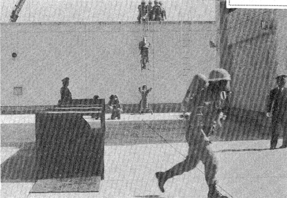
▲市内のビルの高層化に伴い、火災などの災害も大型・複雑化することが予想されるため、いわき市では市内5消防署に救助隊を新設し、4日午後、警備消防署で発足式