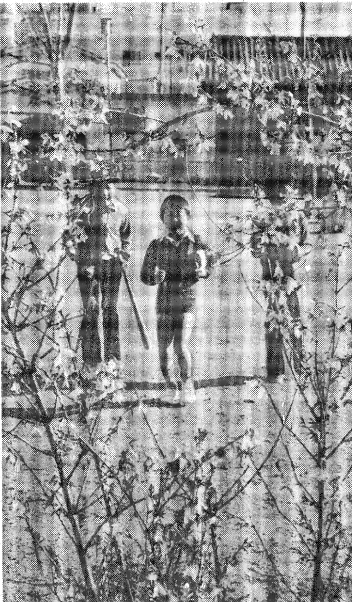
キャッチボールの児童達にほほ笑むレンギョウの花

〇：花べりのわがかな 日差しの中でレンギョウが五分咲き。真っ黄色の花弁が目にしみる。サクラに比べて、花がけを愛おむ歌している。