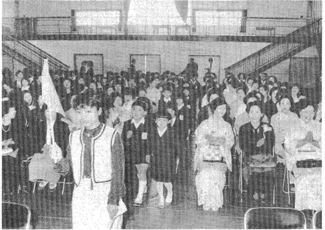
▲4日から、いわき市内109の小・中学校の新学期がスタート。入進学を祝うかのように朝から晴れわたったこの日、市内69小学校では義務教育の第一歩を踏み出す5660余人の新入生を迎え午前10時から、40中学校でも午後1時から入学式が一斉に行われた。写真は6年生と父兄の拍手に迎えられる新入生＝平一小で。