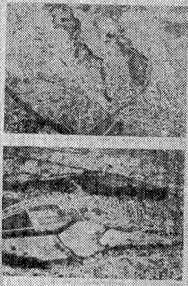
発掘完了の八幡台遺跡。1年目で発掘された本書

いわき市教育文化事業団(さ)の町に続き四年ぶり五冊目の埋蔵 品「八幡台遺跡」(植田町) 文化財調査報告書、昨年五月の 報告書を刊行した。さる五十一 年に発掘した「八幡台遺跡」(小浜 スレド)刊行。