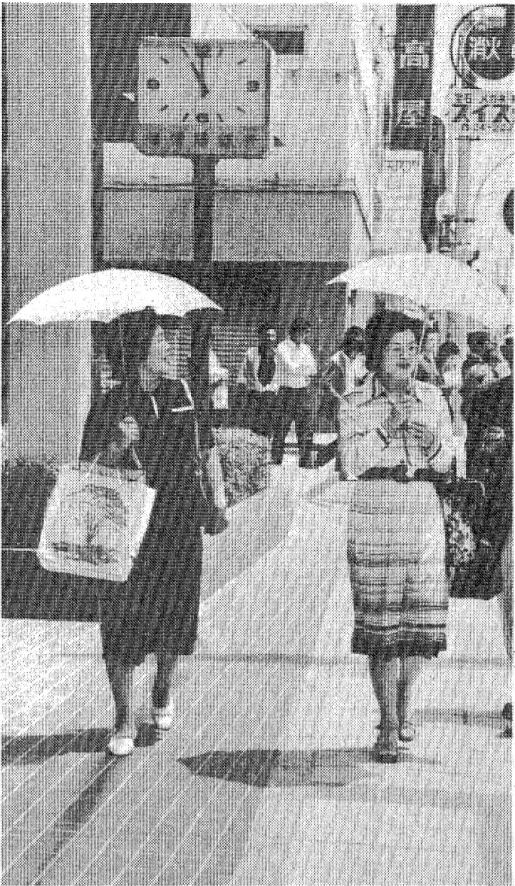
「今日は暑い」があいさつがわりになった平本町通り

内水面漁業では夏井川、鮫川の魚族の増養殖を進めるが、そのうちでも北谷漁場の規制強化から河川に放流するサケが見直された。今年度は夏井川に放流数を三万五千匹、鮫川に九万八千匹をそれぞれ見込んでいく。