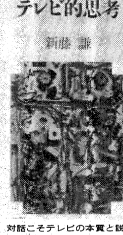
対話こそテレビの本質と説く

それら両方をつまみ食いと思 うたの生活実感は、多分正し いものだろう。とわたしは自分の ゆえに、また本書が書かれねば ならなかつた。「テレビ」とい うのは、それが単なる「娯楽体 の範疇に収まらない伝達媒体、生 活の中心に立つたために、毀誉褒貶