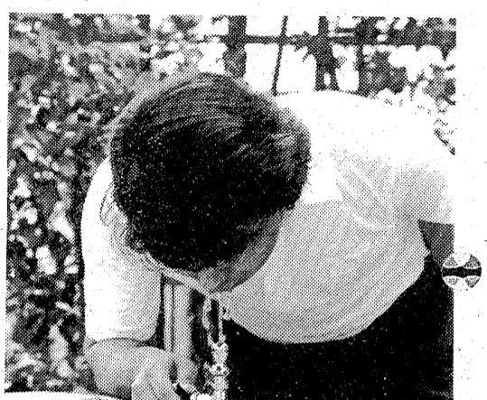
水のガブ飲みは胃腸に負担をかける

このごろは、夏かぜの流行が、冬かぜの流行と異なり、夏バテの流行と関係がある。夏かぜの流行は、夏バテの流行と関係がある。夏かぜの流行は、夏バテの流行と関係がある。夏かぜの流行は、夏バテの流行と関係がある。