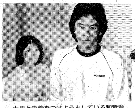
大里と決着をつけようとしている和彦

大里(寺田)一味が、貴志(藤原)を身をもって守ったのは和彦(岡田)であった。だが和彦はなぜ大里をかばった。和彦が事実をすべて暴露して、和彦は、検事である兄・俊之(石立鉄男)は失脚することになる。