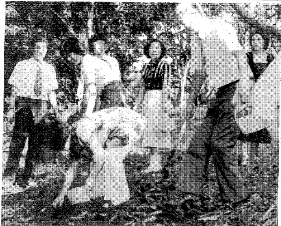
早くも多くの行楽客でにぎわうクリ園