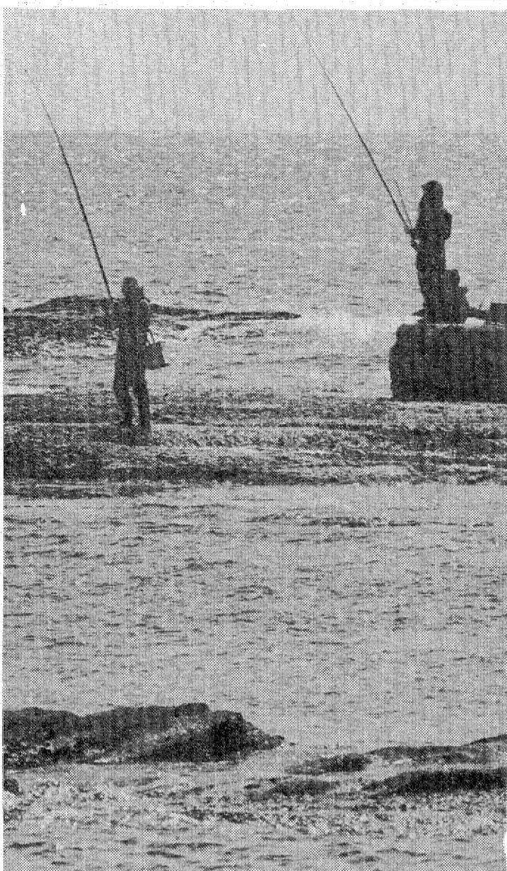
キラめく波を相手にみじろぎもせず立つ釣り師—豊間港の沖磯

五十一年七月十六日、第一回、いわき市農協合併研究促進協議会、新市長の田畑市長が終局的