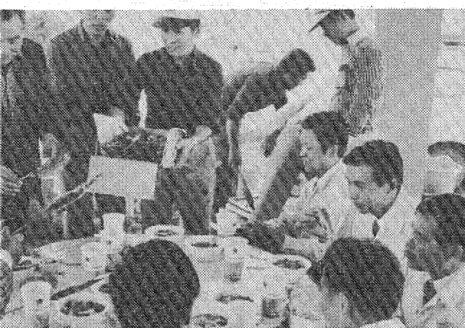
心と味覚で日中交歓する芋煮会

地産物産振興会は、地産物の販売を行っている。従業員は二百五十三人。うち四十五歳以上は半数強の百二十二人(五二・一%)で、五十五歳以上も二十一人(一〇・六%)雇用されている。同社は炭酸飲料製造中心に中高年齢者雇用、採用時に健康診断と職場見学による教育を実施し、高齢者には重労働・高温・高湿・高所作業現場から外すなどの配慮をし、定着率を高くしている。