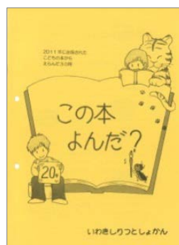
表紙のイラストには、その年に選ばれた本のヒントが散りばめられています♪