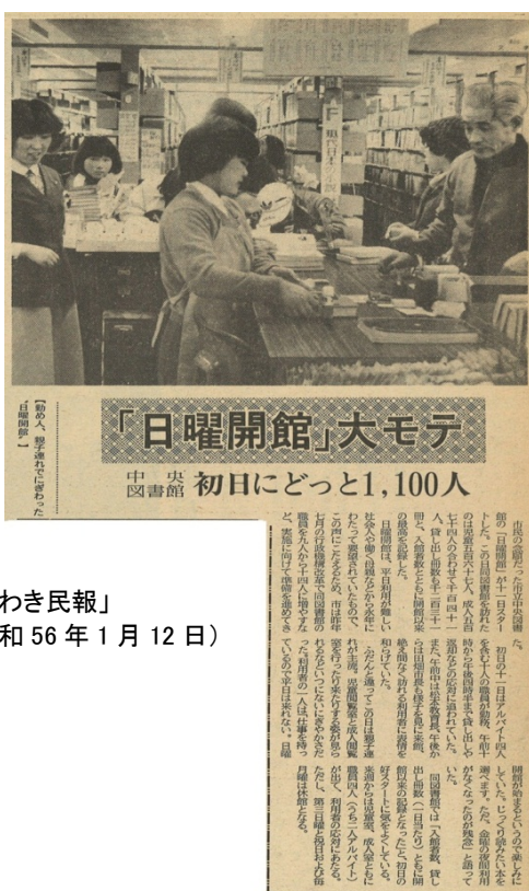
(「いわき民報」 昭和 56 年 1 月 12 日)