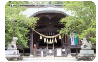
澤村勘兵衛を祀る澤村神社