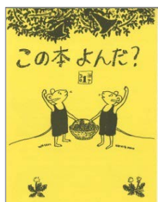
記念すべき第1号は、あの名作が表紙でした！ 【1993.3月発行】