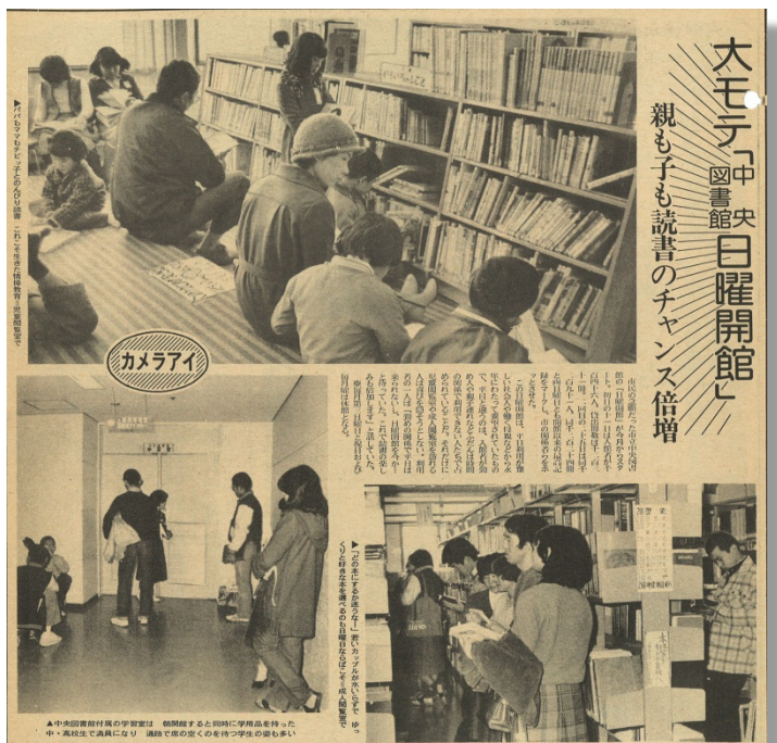
(「いわき民報」昭和 56 年 1 月 29 日)