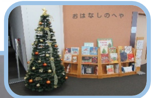
クリスマスツリー

総合図書館の中に飾っているツリーは、全部でいくつあるでしょうか？ 4階の本の展示と一緒に探してみてね。