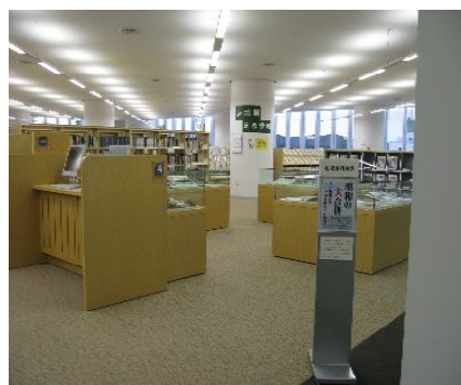
いわき資料コーナー

交流都市や観光関係、文化施設などの、いわき市に関連があるホームページのリンク集があります。