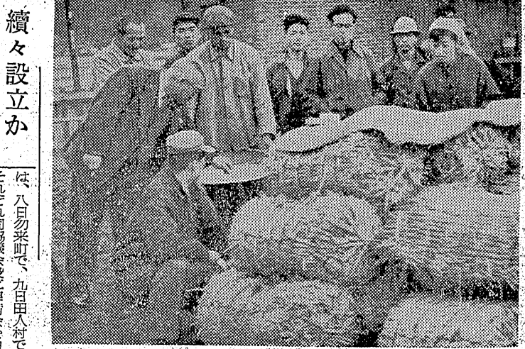
十日現在八十五、二十日現在九十五、三十日現在九十五、四十日現在九十五、五十日現在九十五、六十日現在九十五、七十日現在九十五、八十日現在九十五、九十日現在九十五、百日現在九十五。