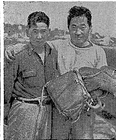
ウォールズ君(左)とウォールズ夫人(右)