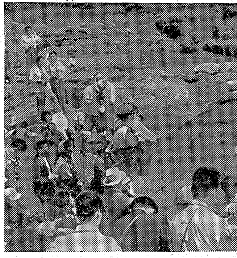
三年前に小名浜海水浴場の人魚に附着していた大亀が、今年もまた網に入り水族館へ。

三年前に小名浜海水浴場の人魚に附着していた大亀が、今年もまた網に入り水族館へ。三年前に小名浜海水浴場の人魚に附着していた大亀が、今年もまた網に入り水族館へ。三年前に小名浜海水浴場の人魚に附着していた大亀が、今年もまた網に入り水族館へ。