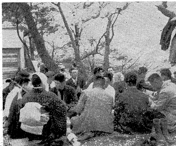
自宅離れた公園で睡眠薬飲み自殺。警署の調べで神志不明からし。平市三丁目商店会。平市三丁目商店会。平市三丁目商店会。

四月一日からの平市。春の祭典。午後三時から七時までは、三味線も出た花見。のめや、唄えや、おらが春。花見が、春の訪れを告げる。花見が、春の訪れを告げる。花見が、春の訪れを告げる。