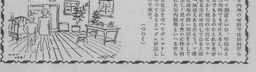
日本内地の家庭では如何だらう。すべて調度といひ、装飾品といひ何時でも手に入る、いくらでもあるのだからこれを充分に生かし我等の生活にマッチさせる事に成功してゐる人達。...