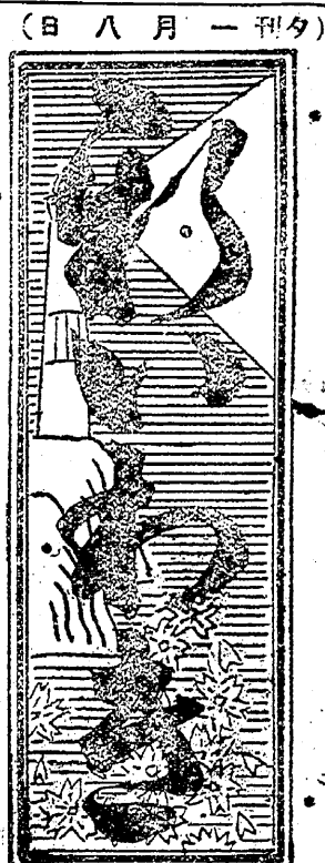
日曜大衆 日一十月三年五和昭 刊日