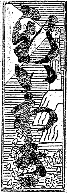
日刊夕日六十二月一十 日刊夕日六十二月一十 日刊夕日六十二月一十