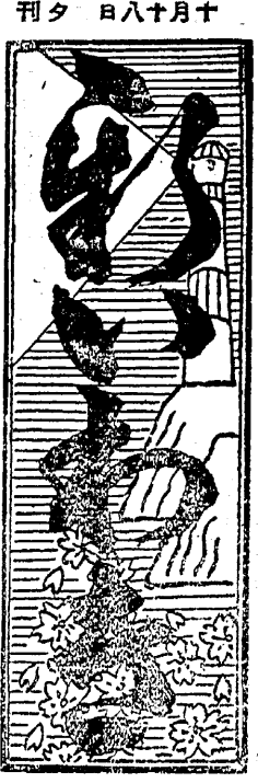
日刊報日曜日... 發行所 平野町三丁目