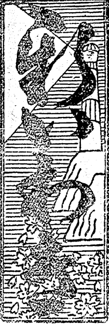
日曜 昭五十二年十月五日 第百八十四號

支那單語 よろしいは行でシン、あふかと云ふことを對不對でトイブトイ、あふと云ふを對トイ、あふかには買不買でマイ、買ふかには買はない、買不買でプーマイ、来たかにはライラマと呼んでる