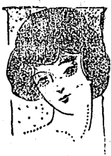
家 庭 欄

石城郡地方の各濱の魚船は何れも秋刀魚漁に出漁してゐるが本縣水産試験場警城丸が漁場調査をなした處に依ると秋刀魚群は本縣沖合三十哩附近に浮游して居り益々大群が押寄せてくるとの觀測なので之を知つた各濱では俄に活氣づき何れも