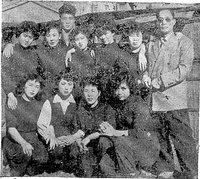
写真は……… 来平する関東代表チーム