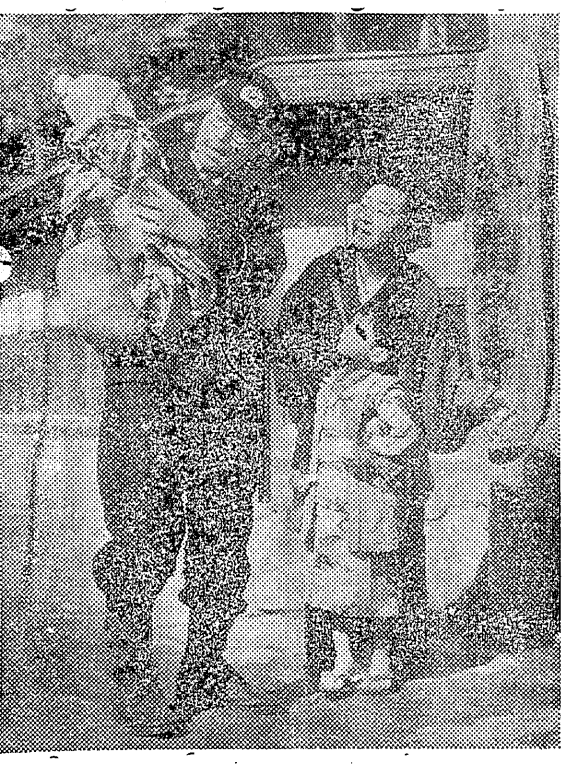
小白井部落の場合には既報の通り出稼ぎから帰った一人の娘が持...

十五以下の男女百六十名が次々に発病した川前村、小林町、大井町、白井町の集団ハシカの原因が、迷信による誤った治療で明らかになった。原因は「ハシカに医者いらず」の迷信による治療で、病者から病者にうつり、集団発生したと判明した。 原因は、迷信による治療で、病者から病者にうつり、集団発生したと判明した。原因は「ハシカに医者いらず」の迷信による治療で、病者から病者にうつり、集団発生したと判明した。