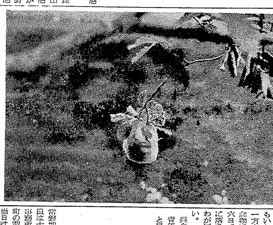
湯本のマケットPTAの会議の様子

湯本のマケットPTAも対策協議。湯本のマケットPTAは、移転先でも反対の声を上げており、対策協議を進めている。これは、地域の住民や関係者からの反対が、移転計画に影響を与えているためである。PTA側は、住民の意見を尊重し、適切な対策を講じる方針を示している。