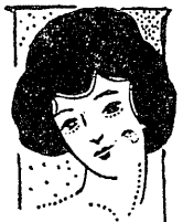
家庭十 庭十 十

天氣が大分つゞいたが此頃は一年中で一番氣候のよい晴のつゞく頃である、ちよつとした低氣壓など却つてごへか追ひ拂はれて勢力を張る事が出來ず平地方は七日の晩も八日も北西の風で天氣がよく此模様ではなほ五六日はつゞくだらうと