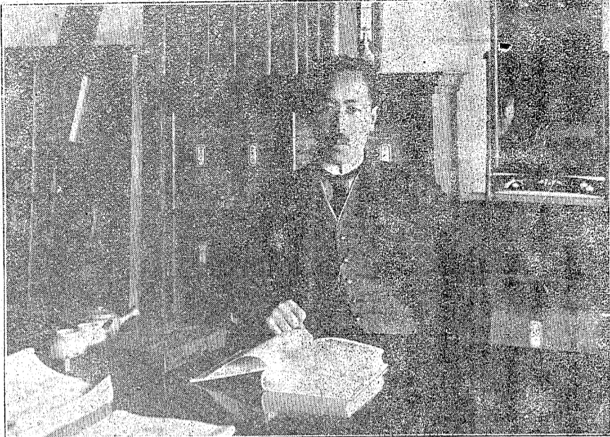
氏則正田柴るあに室長校は眞寫

今日農村教育及小學教育は自己腹中の教師を糾合し の施政職に呼ばれる。際して勢力擴張を策動するを敢 して、夫等の功果に直接關する、小學教育界の腐敗 係する者は小學校長の立場 墮落の現状に對し本郡警備 にある人の自重反省に俟ち 尋常高等小學校校長柴田則 て期さなければならぬのは校長の如き清廉の士は地方 勿論である。然る 地方民稀に見る教育家にして本村 教育の任に衝る所謂地方教の爲に代民衆を創造せる最 育家なる者は昨今殆んど自高の農村文化人として茲