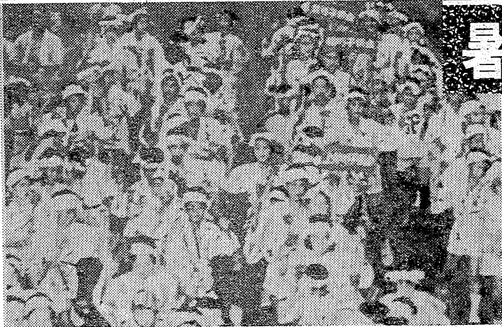
【コース】◎1班18時温泉神社前出発～上町～横町～天王崎～湯本駅前広場 ◎2班18時10分温泉神社前出発～上町～中央通り～天王崎～湯本駅前広場