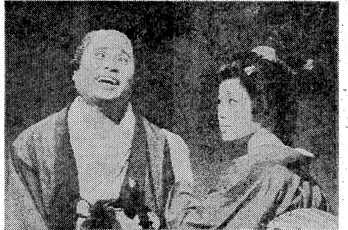
後藤三右衛門が三千歳まどくどくのだが...