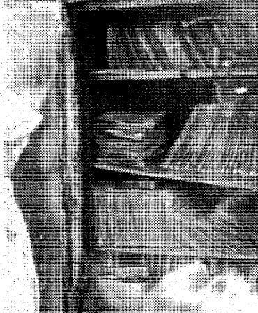
無事だった耐火金庫の中の学 籍簿など重要書類