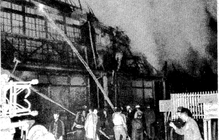
燃えさかる平五小校舎 延焼くい止めるだけで精いっぱい

焼けた校舎は昭和十二年(平市)が誕生に、また焼けた東側の校舎は、大正十一年に建てられたもので、いずれも危険校舎指定されており、五十二年度から三カ年計画で建て替えることが決まっていた。 焼けた校舎は昭和十二年(平市)が誕生に、また焼けた東側の校舎は、大正十一年に建てられたもので、いずれも危険校舎指定されており、五十二年度から三カ年計画で建て替えることが決まっていた。