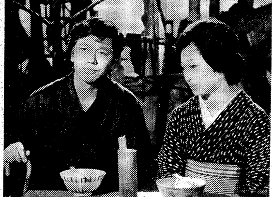
夢二は大震災で持っていた夢もすべてを 失い、焼けあとをおとすれたたまき(浜 木綿子)とひっそりと語りあう

一年前、殺人者の濡れ衣を着て おれ討つお松(本阿弥周子)を 救った。 鎌倉八幡宮参詣の帰り道、ゆきた おれ討つお松(本阿弥周子)を 救った。