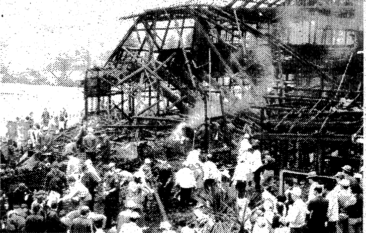
無残な焼け跡を沈痛な表情で整理するPTA