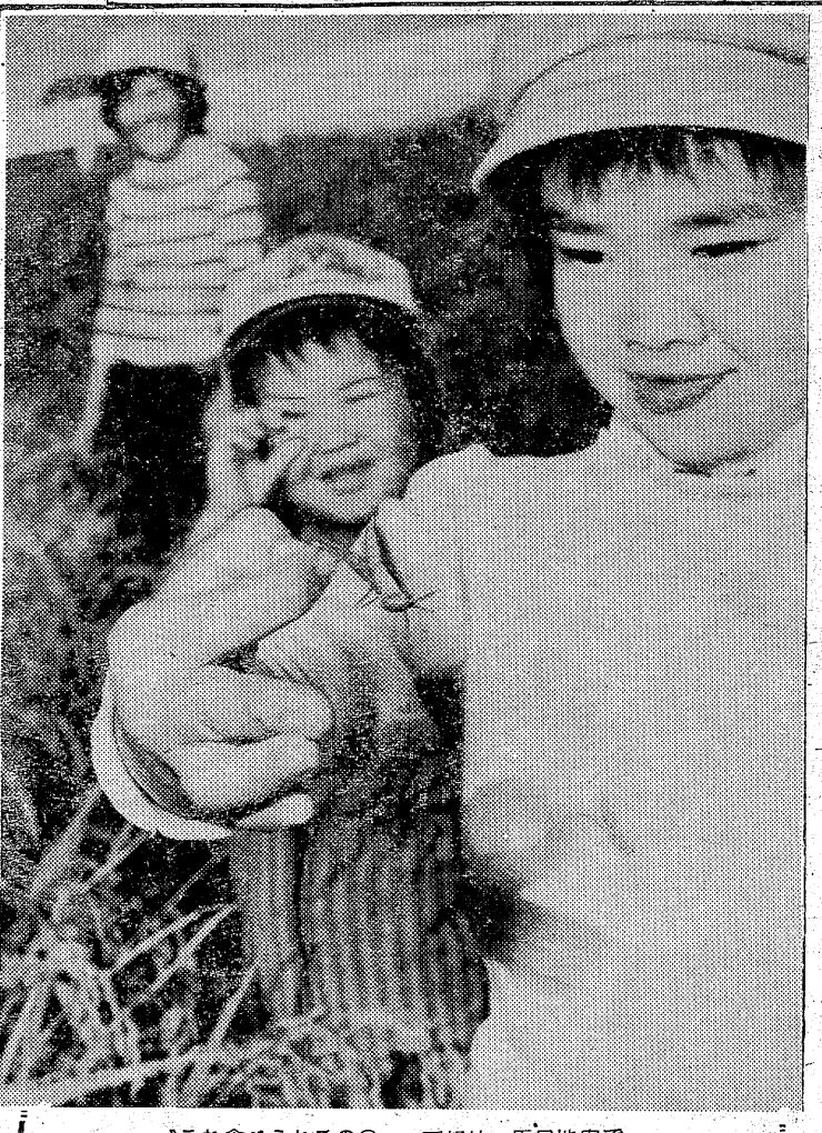
「これ食べられるの?」平郊外・馬目地内で 味が主婦の自慢話になる農地帯だが、ナイロン製片手に、余暇をみつけては、農作の「イナゴ」採りに余念がない。

「料金を不明だ」「文句を言うのを来くれぬい」市民生活に欠かぬし尿くみ取りに、よごした不満の音が聞かれる。その最大の理由は計量のあいまいさ。しかも、そのあいまいさ、いちいちメーターを確かめて料金を支払うといった、自衛手段、も取りいへず、住民は黙然として、何も感じながらも、なんともくまなくまわっている。この不明朗な現実に行けるような事件が、いわき市植田町一五二、勿来清里古川宮野社長に、