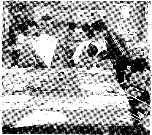
手さばきもあざやかに、タコ作りをする会員