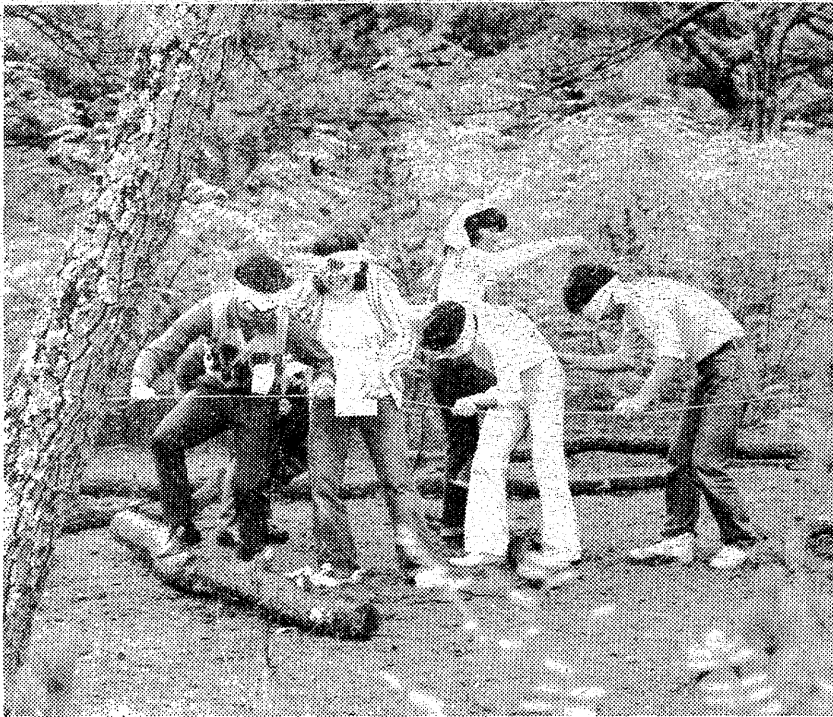
目がくしをし、一本のロープを頼りに目的地に進むフィールドワーク

「おはよう、」と、早いねり持ってきた「サンキュー」を持ってユースホステル松林へ。午前六時半、この日の行事「手探りでやみの世界」の準備を進めてきた委員八人が、マイカーに乗って集まって、頭で空を見上げるが、少しも暗れが降り出し、会員の顔は様々に憂鬱な表情を受けて、今にも「そうさ、」とつぶやいて、開会式予定の同時、雨のため