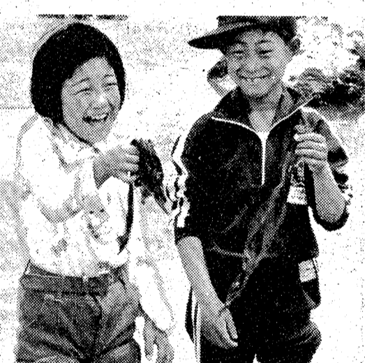
今年のはほとんど影響がないとみて良いでしょう。油自体も自然に分解し、あるいは海に散らさず、まず安全と見なされています。