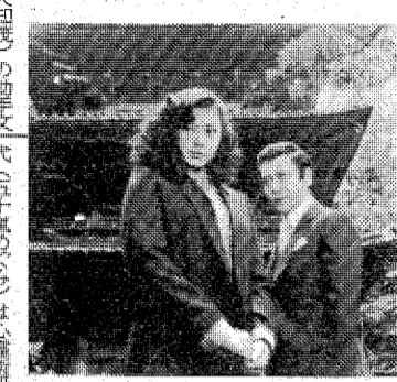
なぞの美少女ははたして何者か?

大木はソックアフト、達平の声をがとんだ。達平は選手をロボット視する達平に反感を持った。一瞬の差で明暗が変わる。それがソックアフトというのだ。だが、