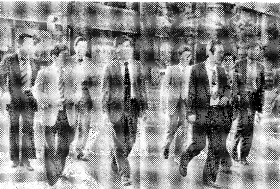
第二の人生に向けて選択をしっかりと