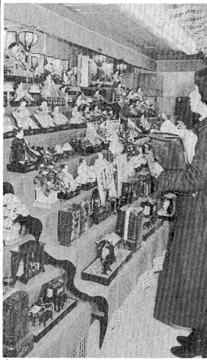
店内に春を呼ぶもの節句のひな人形=平・フジコシ=

転作率は19.6%に 軽減面積は、各農協ごとの第二期目標面積増加分の軽減率を掛けて配分された。その結果は、平五十七・八、三和、菊田各二・八%となっている。 と、川前だけは十二・三%、上