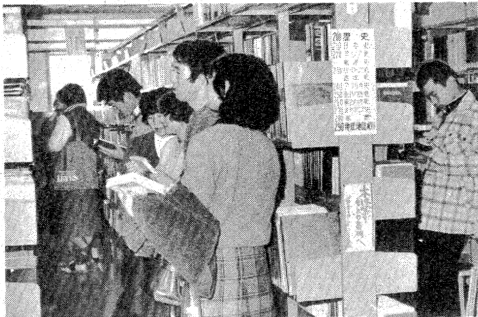
▶「この本にするか迷うな」若いカップルが水いらずでくりと好きな本を選ぶのも日曜日は、その成人閲覧室で