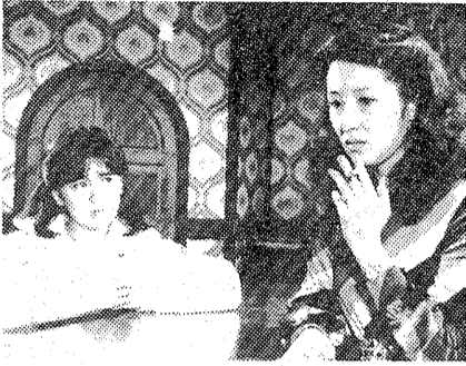
くに江のもとを訪れた智

「賢か兵衛夫婦の笑の娘でないことを知り悩んでいる」とは、(笑)といっておかしな感もありません。