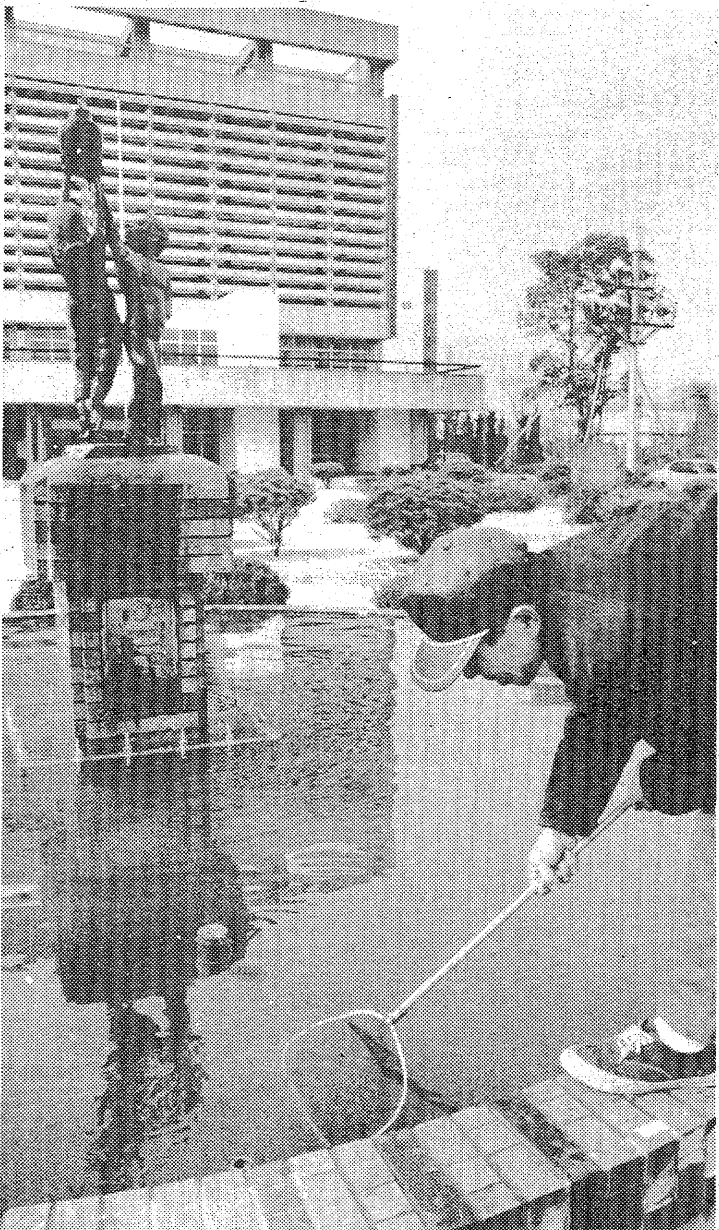
早春のさざしのなかで池の清掃作業—平市民会館前で—

九割以上がサラリーマン化し、今回の引き上げでほとんど他地区減反に次ぐ減反の稲作を中心とした農作業だけに他人の手が重要になったが、同市のソレはこれまでを越す冷害を受けた立ち直り年だ。他地区に比べて高かったため、例へば、農家の急激な負担増をきたした。算定基準には他産業の賃上げ率、米価、消費物価指数(過)上がり率(同)五・二%で、これに冷害という特殊事情を考慮、雇員会調べにもと、他産業労働者用労働賃金は三・一%、請け負い労働賃金は三・五%の平均一九・二%となった。雇用では果樹園での一般作業