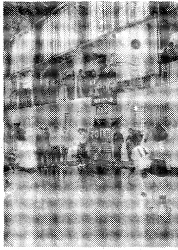
【中学校バスケットボール大会】