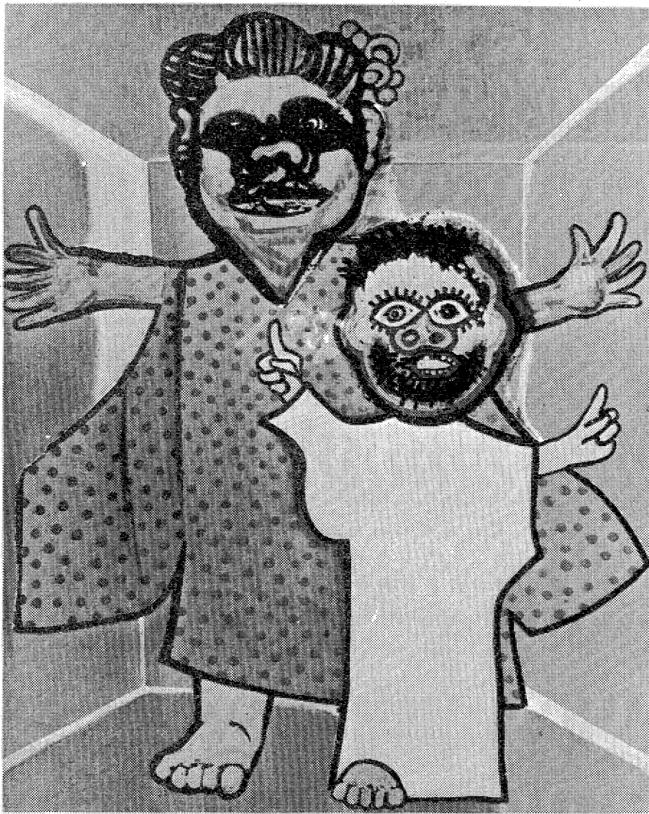
おねえちゃん(二五〇号)