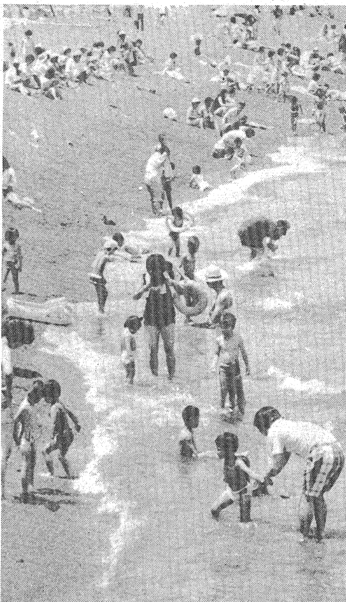
水は冷たく、浜はしゃく熱、波打ち際は天国と地獄の境一浪立海水浴場

農林漁業、海水浴に黄信号 異変、陸と歩調合わず 親潮勢力強く南下停滞 冷水域の異常南下で、今後本県沖でも昨年の低水温傾向が予測され、農林漁業、海水浴に、警信号。十日、県水産試験場(秋元登馬場)が、東北海沿いにおける漁海況予報を発表した。陸との異常気象と歩調を合わせた、海の異常だ。特に冷水域現象が顕著であった昭和三十八年当時冷夏・豪雪と塩屋沖の水温偏差が極めて似ている点も不気味。同水試では今後、適宜に漁業者を集めた漁海況予報会議を開き、海の異常に対処する考え。