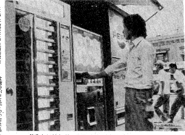
飲みたいけれど、ここでグッとこらえるのがカギ

一日の摂取量は20gが標準 肥満が諸悪の根源であることは説明するまでもない。糖分をとり過ぎると、それ以外では必要な栄養素が不足して、さまざまな病気を引き起こす。砂糖がエネルギーを生産し、使われるとき、ビタミンBを消費するので、ビタミンBを補給しなければならぬ。砂糖の過剰摂取は、虫歯になること知られてはいるが、スィ臓の働きを弱めるので、糖尿病にもつながる。 また、肝臓では中性脂肪が作られるので、動脈硬化や心臓病に結びついてしまう。 砂糖の摂取量は、一日20gが標準だ。