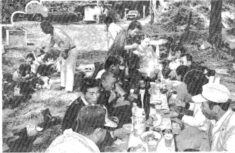
▼屋外の宴席で マツタケ料理をさかんに酒宴がにぎやかに開かれる