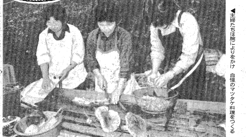
▲主婦たちは腕こりをつけ 自慢のマツタケ料理をつくる