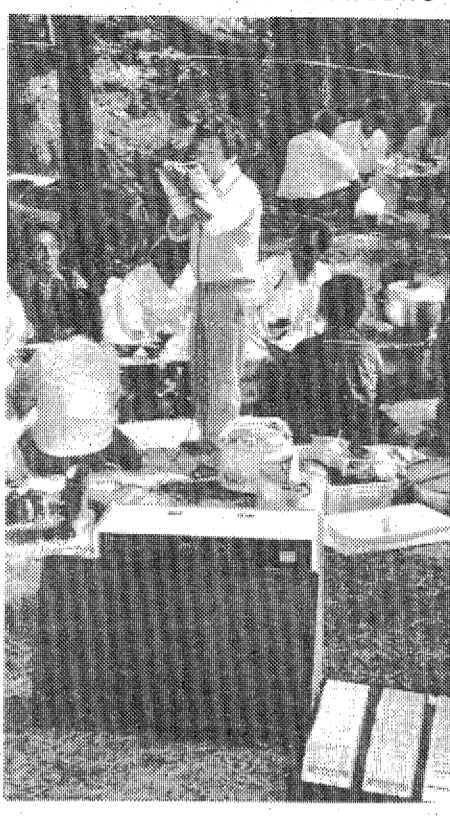
▼持参のカラオケで自慢のノドが披露される

秋の山のダイヤモンドといわれ「マツタケ」が、好天気に恵まれて豊作になった。二数年間不作に泣かされてきたいわき市四倉町玉山地区のマツタケ山は、六日の山開き、深城原(なげがら)外から予約観光客でにぎわい、閑古鳥が鳴いた昨年までの悪夢がまるでウソのよう。 マツタケ山関係者で、男は調理場兼用、小樽に宿泊、夜間は山の「マツタケ」が、好天気に恵まれて豊作になった。二数年間不作に泣かされてきたいわき市四倉町玉山地区のマツタケ山は、六日の山開き、深城原(なげがら)外から予約観光客でにぎわい、閑古鳥が鳴いた昨年までの悪夢がまるでウソのよう。 マツタケ山関係者で、男は調理場兼用、小樽に宿泊、夜間は山の「マツタケ」が、好天気に恵まれて豊作になった。二数年間不作に泣かされてきたいわき市四倉町玉山地区のマツタケ山は、六日の山開き、深城原(なげがら)外から予約観光客でにぎわい、閑古鳥が鳴いた昨年までの悪夢がまるでウソのよう。