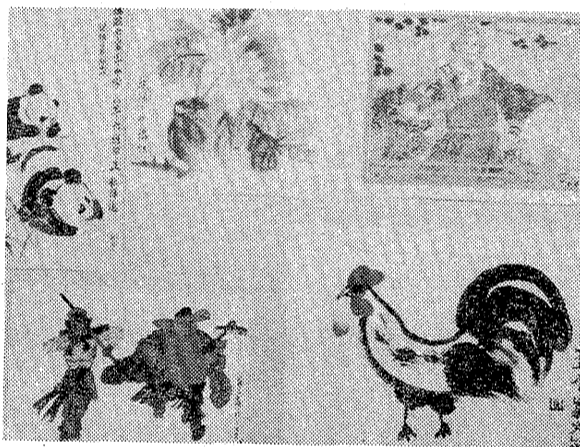
パンダや孫悟空など楽しい絵がいっぱい

「中国の子の絵は上手だねえ」平二小(植田信雄校長、児童数四十七人)にこのほど、中国撫順市の小・中・高校生が贈った絵が寄贈された。同市はいわき市と友好姉妹都市を結ぶことになり、今年ばかりは、いわき市を訪れ、平二小を訪ねて、撫順市の子どもたちが描いた絵や、ししゅうをプレゼントした。絵はクレヨンや水彩、それに水墨画も。小学生のは人形や動物の姿、中学生は、動物園のパンダや公園の風景、動物園を描いた。またマンガでおなじみの鉄腕アトムがロケットに乗って月へ向かい、眼下には万里の長城が見え、遠くには山は雪で白く、「中国の子もアトムを知っているのかな」と、アトムの手。