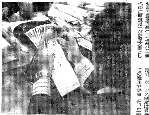
年にわずかのボーナス。その歴史は...

この語源は、ラテン語のボヌス(bonus)に由来する。つまり「好むべきもの」の意。英語の辞書にもbonusで出てくる。が、意味は「特別配当金」「副賞金」の方が強い。欧米では、日本みたいな賞与制度がないから。この言葉、十八世紀後半に英国で使われるようになった。産業革命期、企業が利益還元をせよと主張するようになった。この場合も「特別配当」の意味が強い。一方「賞与」なる言葉は、なんと中国の清の時代、一七八三年に書かれた「紅樓夢」という小説に出てくる。日本では、最初ルンペンが使う。最初ルンペンを