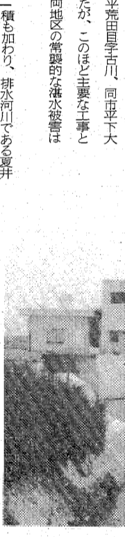
五年がかりで完成したポンプ場

同地区は平の市街地から東に約一キロの農業地帯。作物は水稲を主体... だが、海抜が低いうえ、流域の明... 排水3日、半分に短縮