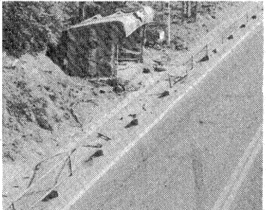
メチャメチャに壊されたガードレール

十三日午前一時五分ごろ、いわき市常磐湯本町辰野の国道6号国道で、平から小名浜方面に向かっていた常磐自動車(常磐)の乗用車が国道左側のガードレールを破り、歩道に横転して四人が死傷した。乗用車は約四十メートルの急カーブを曲がり切れず、ガードレールを破り、歩道に横転した。乗用車は約四十メートルの急カーブを曲がり切れず、ガードレールを破り、歩道に横転した。