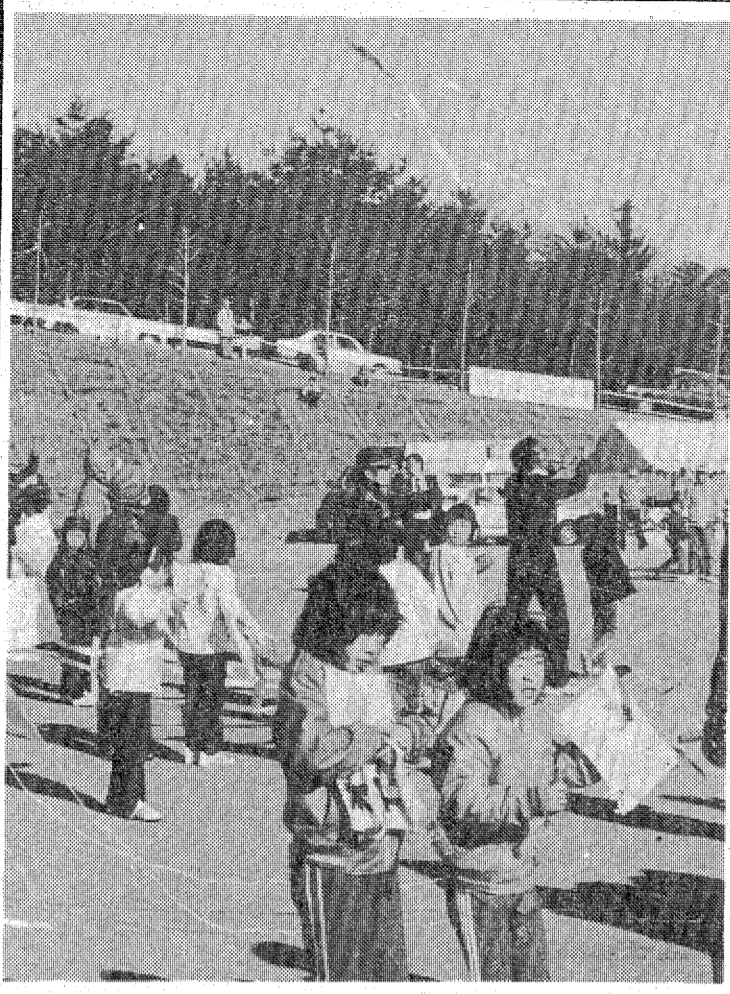
寒風に負けず元気にタコ揚げを楽しむチビっ子たち

泉宮内を流れる夏井川流域農地の湛水(たぐすい)被害を防ぐため、五十二年度から、いわき市平井田目字古川、同市平下大... 泉宮湛水防除事業を進めてきたが、このほど主要な工事... ボンプ機の据え付けが完了し、先月末、現地を完了式が行われた。排水場が完成したことで、同地区の常態的な湛水被害は大幅に軽減されることになった。