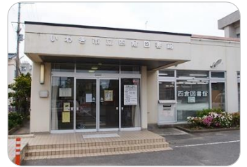
よつくら としゃかん