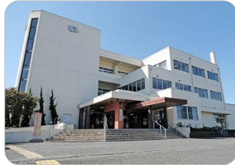
うちごう としゃかん