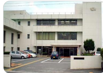
なごそ としゃかん