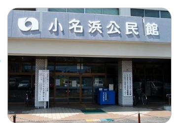
おなはま としゃかん