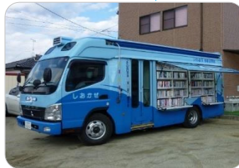
いどうとしゃかん しおかぜ