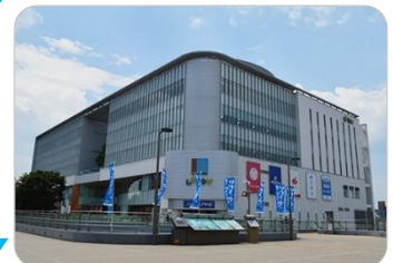
いわきそうごう としゃかん