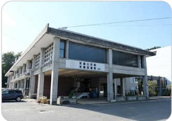
じょうばん としゃかん