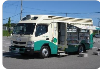
いどうとしゃかん いわきごう

いわき市内には、6つの図書館があります。 このほかに、2台の移動図書館車 「いわき号」と「しおかぜ」があります。