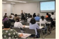
<セミナー会場の様子>

当日は、43名の方が受講され、「iDeCoやNISAについて言葉は知っていたが、非常に良い機会となり、資金について考えるきっかけになった」「不安に思っていたことが解決できた」「もう少しお話が聞きたかった」などの感想がありました。