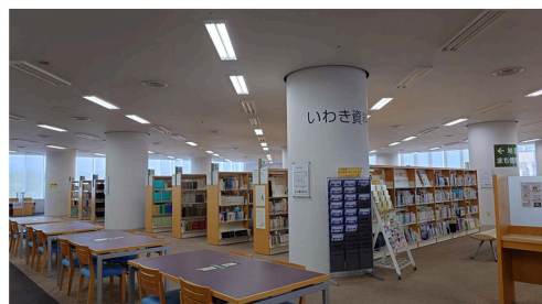
いわき総合図書館5階「いわき資料フロア」

ここでは、いわきの歴史からおいしい食べ物の情報まで、いわきのことなら何でも調べることができます。