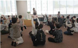
あかちゃんへのおはなしかい