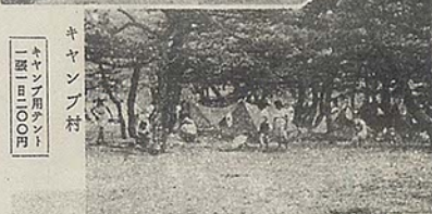
キャンプ村 キャンプ用テント 一張り一〇〇〇円