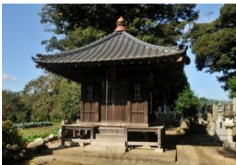
利安寺の大日如来堂