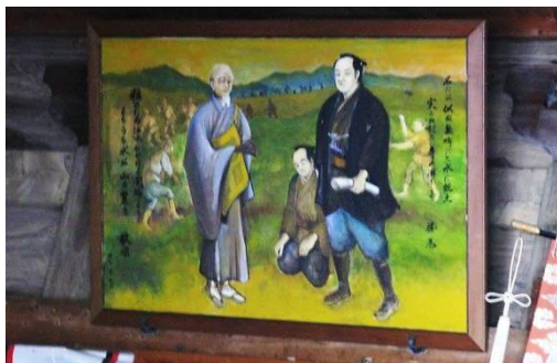
社殿には坂本勇氏による勤兵衛と歎順の出会いを描いた絵が掛けられている