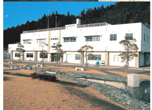
小川江筋取水口(上)と平浄水場(下) 平下平窪