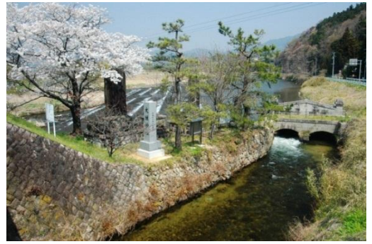
小川町関場の取水口。寛永時代、住民が地域の安泰と豊作を祈念して水神を祀ったのがはじまりという大堰神社がある。

小川江筋は、磐城小川江筋土地改良区が改修を行ないながら、維持・管理して守り伝えています。