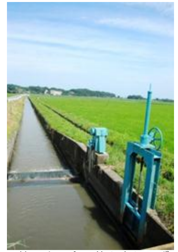
江筋の水は今も昔と変わらず田畑を潤している。