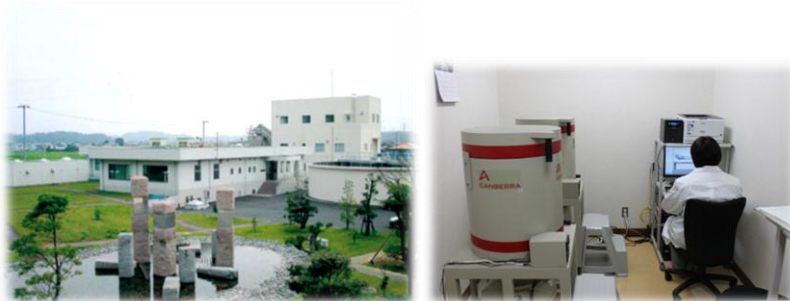
水質管理センターとゲルマニウム半導体検出器