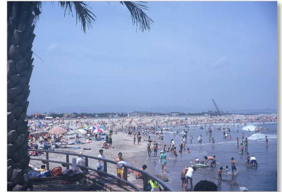
新舞子ビーチ (平成 7 年 7 月、いわき市撮影)