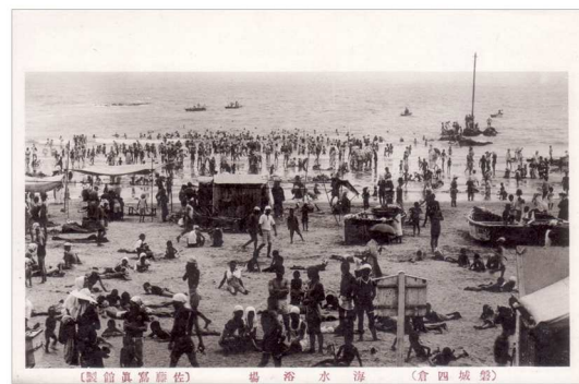
【絵はがき】「磐城四倉」海水浴場 (大正時代)

それに対して、松川磯(現勿来)海水浴場は、勿来駅から距離があったことなどから、知名度はあまり高くありませんでした。しかし、大正末期から乗合バスが発達したことで、交通の不便さが解消されていきました。