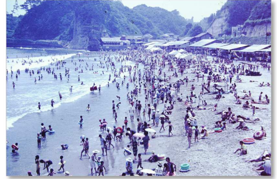
勿来海水浴場を北側から見る (昭和 41 年、いわき市役所所蔵) →