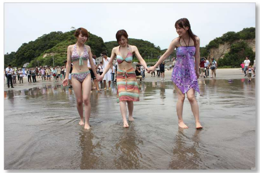
海開き（平成 24 年 7 月）

平成 23(2011)年 3 月に発生した東日本大震災での大津波によって、いわき市の沿岸部は、大きな被害を受けました。この復旧のため防潮堤の工事が進められたことなどにより、平成 24(2012)年には勿来海水浴場、平成 25(2013)年には四倉海水浴場、平成 29(2017)年には薄磯海水浴場、令和元(2019)年には久之浜・波立海水浴場が、それぞれ再開されました。