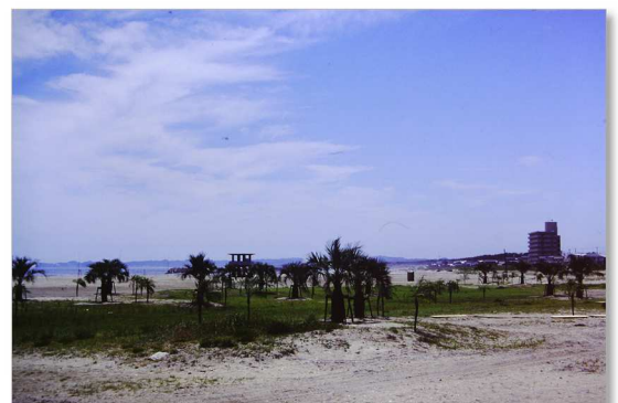
四倉海水浴場 (平成 7 年 7 月、いわき市撮影) →

「オアシス 40 構想」は、四倉地区のまちづくりグループの「00Y(オーイ)三集」と「四倉町の二十一世紀を考える会」によって企画されたもので、いわき市の姉妹都市であるオーストラリア・タウンズビル市のイメージを取り入れたまちづくりの土台として、「ヤシの木」の植樹や遊歩道の整備が行われました。