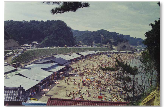
勿来海水浴場「海の家」を南側の侍岬から見る (昭和 50 年)

そういった中で、久之浜海水浴場は、費用対効果を考慮し維持・存続が困難になったため、平成 14(2002)年を最後に廃止となりました。それに伴って、波立海水浴場が「久之浜・波立海水浴場」に改称されています。