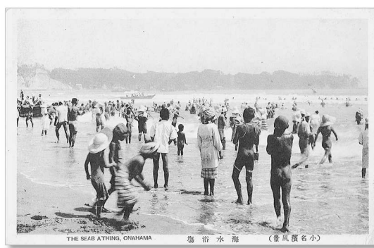
【絵はがき】「小名浜風景」海水浴場 (大正時代)