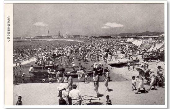
【絵はがき】小名浜海水浴場の賑い(昭和 20 年代)

それまで、侍岬から二つ島までの間に開設されていましたが、海水浴客の増加によって、海水浴区域外にも人があふれる状態が続いたことなどから、昭和 45(1970)年には、潮流の激しい二つ島周辺を除いた北側に区域を延長し、約 1km に及ぶ海水浴場となりました。