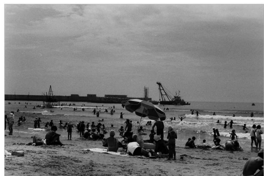
四倉海水浴場(昭和 44 年 7 月、いわき市撮影)

国道 6 号の整備は、四倉海水浴場にも影響を与え、昭和 40 年代の四倉港の拡張もあいまって、徐々に南方へ移動していきました。