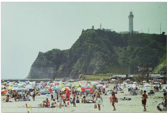
薄磯海水浴場と塩屋崎灯台を北側から見る (平成 11 年 8 月)

平成 8(1996)年、薄磯海岸が「日本の渚・百選」に選ばれました。これは、日本の渚百選中央委員会によって、全国の海や湖沼等の渚の内、良好な状態で保存されている 100 か所が、「海の日」の祝日制定を記念して選定されたものです。