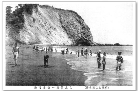
【絵はがき】「磐城久之浜名勝」 久之浜第一海水浴場 (昭和時代初期)

この間、各海水浴場では、脱衣所や休憩所などの施設が整備され、海水浴のための臨時列車や臨時バスが運行されるなど、海水浴は、夏季のレジャーとして多くの人を呼び込みました。しかし、戦時色が強くなるにつれて、レジャーとしての海水浴は影を潜め、昭和 19(1944)年には禁止されてしまいました。