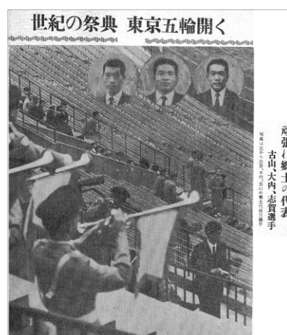
『常磐毎日新聞』 昭和 39(1964)年 10 月 10 日 1 面