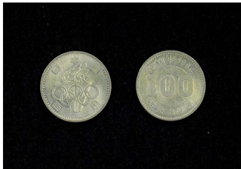
東京オリンピック記念 100円銀貨 左：表面 右：裏面

当時の新聞記事では、長蛇の列ができたと報じられており、人気のほどがうかがえます。