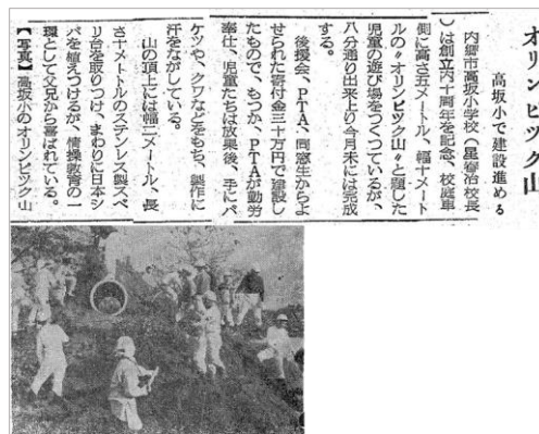
『常磐毎日新聞』 昭和39(1964)年11月16日 3面

また学校では、運動会でオリンピックにちなんだ競技が行われた他、記念石(川部中学校・川部町)の寄贈や、学校の創立記念と合わせ、児童の遊び場として「オリンピック山」(高坂小学校・内郷高坂町)の制作などが行なわれました。