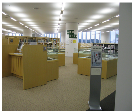
いわき資料コーナー

交流都市や観光関係、文化施設などの、いわき市に関連があるホームページのリンク集があります。